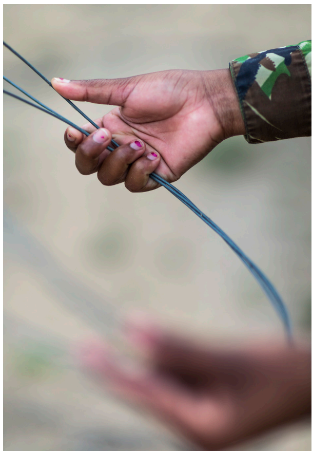
Att rensa naturreservatet på snaror ingår i mambornas arbetsuppgifter.

När The Black Mambas patrullerar lyssnar de även efter tjuvjägare och tittar efter spåren