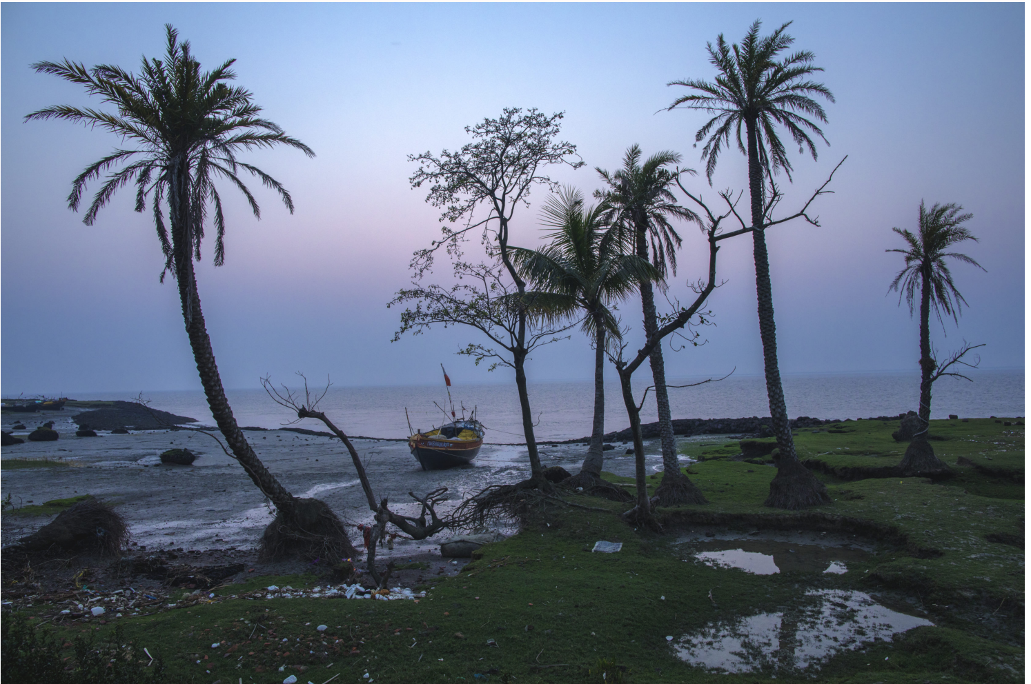
Ön Ghoramara island har drabbats hårt av klimatförändringar i form av höjda vattennivåer och kraftiga cykloner.

Längre österut, mot gränsen till Bangladesh, leder klimatförändringarna till direkt dödliga konflikter. I denna del av Sundarbans lever ett stort antal bengaliska tigrar (det pågår för närvarande en räkning av antalet tigrar i Sundarbans, men sammanlagt rör det sig om några hundra djur både på den indiska och bangladeshiska sidan) som ser sina jaktmarker minska när vattnet stiger. På sistone har allt fler tigrar, som simmar över floderna, rapporterats i byarna i jakt på tamdjur som kor och getter. Samtidigt tvingas byborna att söka sig in i skogen för att hitta nya sätt att tjäna pengar när