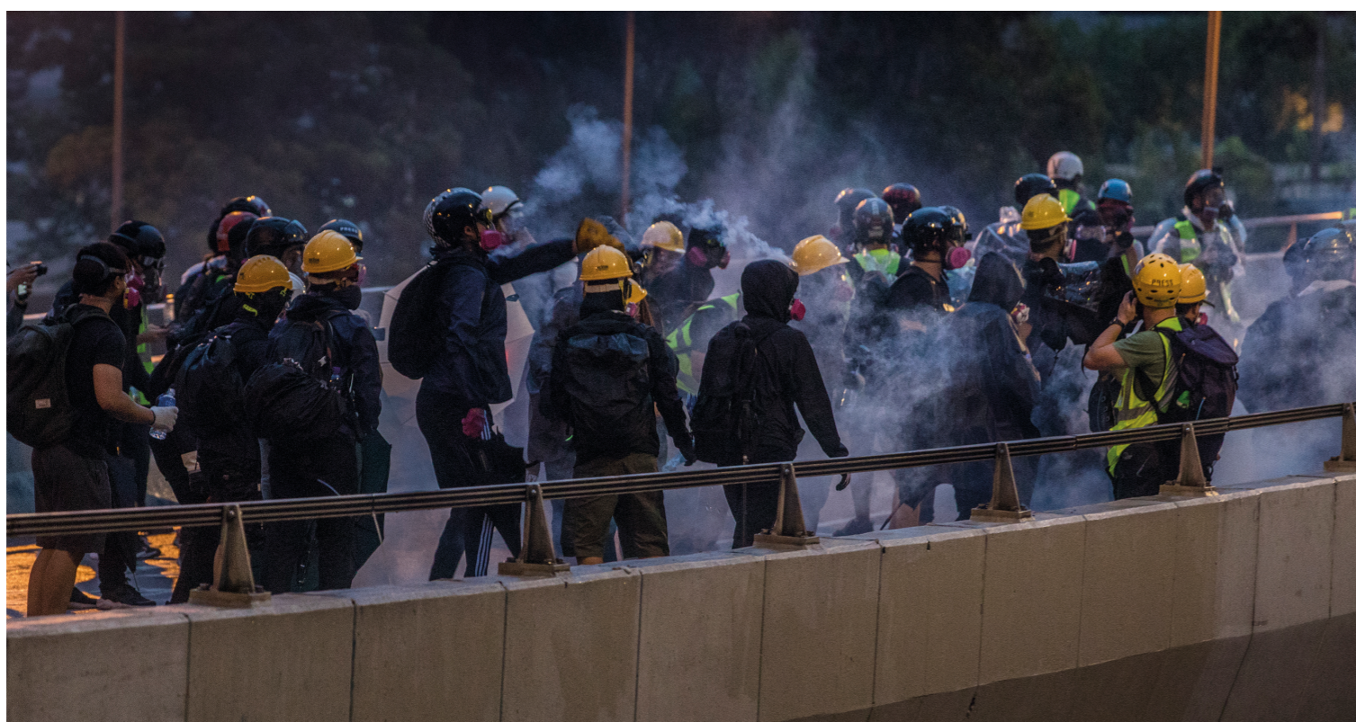
Moln av tårgas stiger upp bland demonstranterna efter att polisen skjutit tårgaspatroner.

TEXT: JOHAN AUGUSTIN