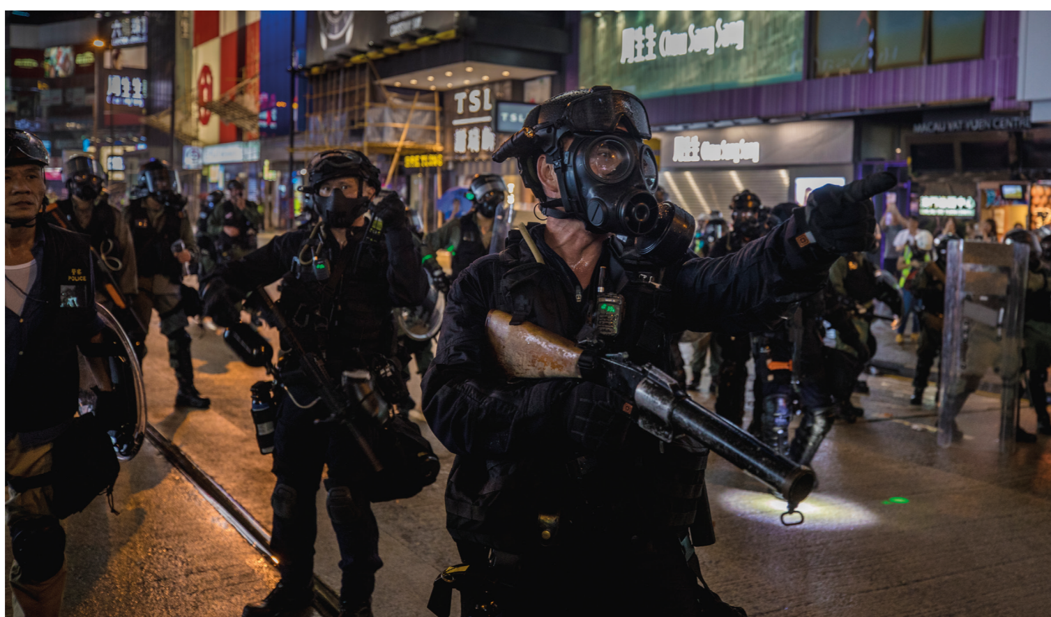
Polisen är beväpnad med gevär som skjuter gummikolor.