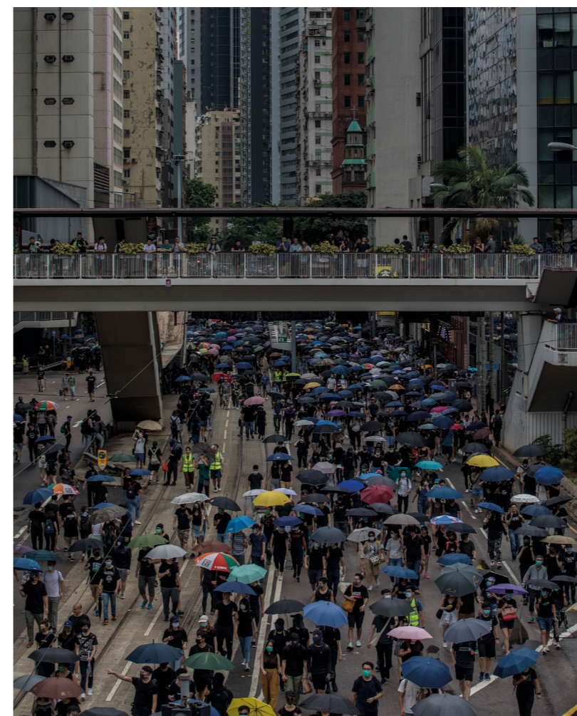
Demonstranter på Hongkongs gator.