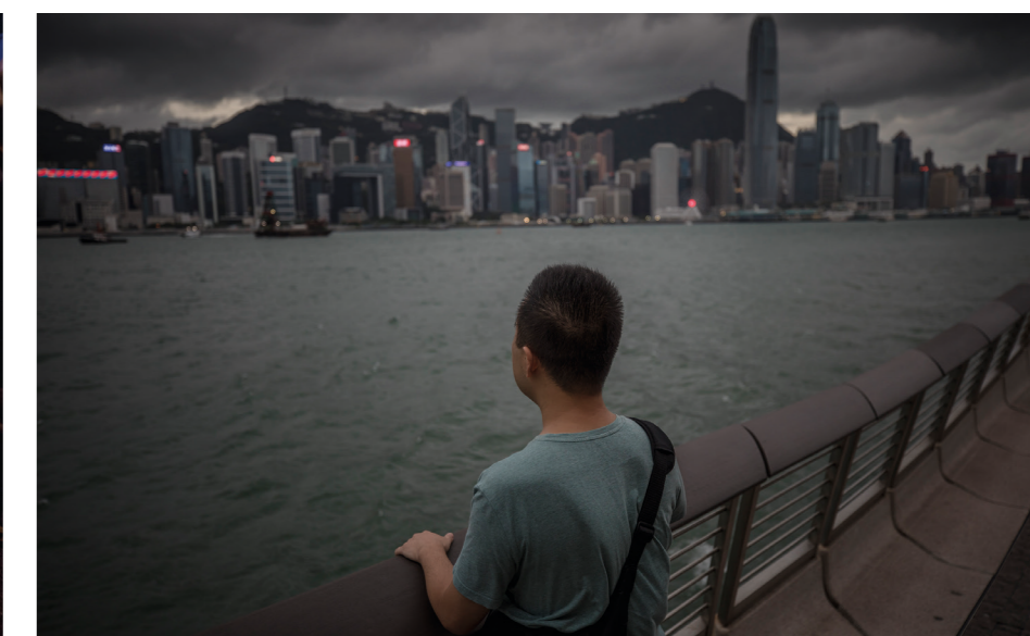
Den kinesiska man som kallar sig för The last stand (den sista utposten).