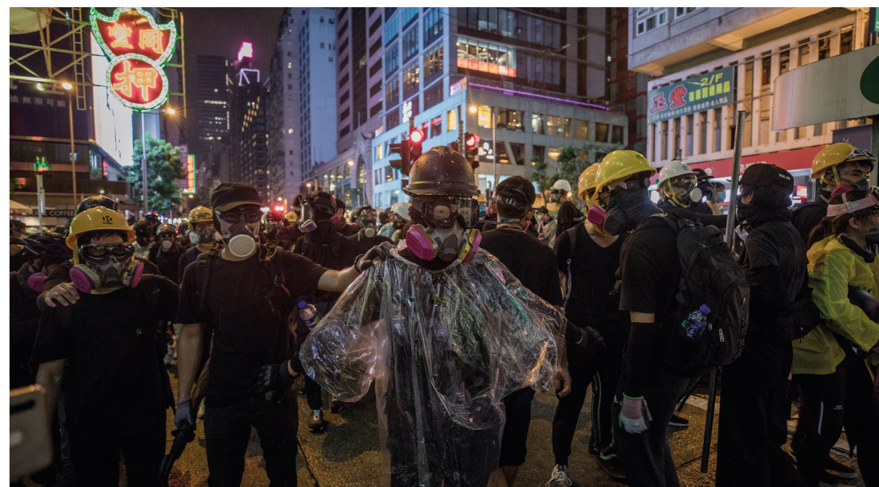
Protesterna startade den 9 juni för att stoppa ett lagförslag som skulle tillåta utlämning av misstänkta brottslingar från Hongkong till Fastlandskina.