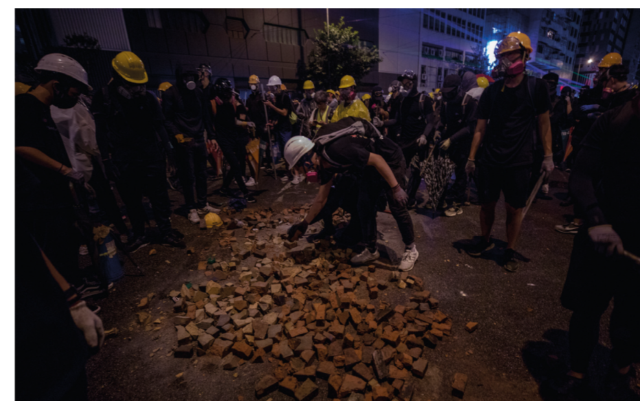
Demonstranter samlar gatstenar för att kasta mot polisen.