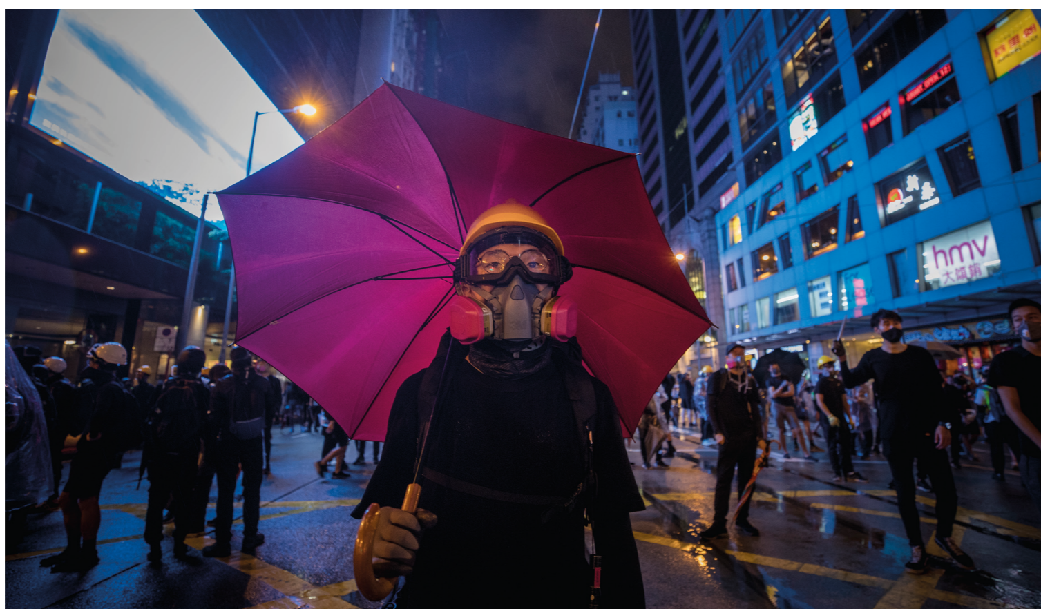
Färgglada paraplyer är ett återkommande inslag i protesterna - och ett arv från det som skedde 2014 och då kallades paraplyrevolutionen.