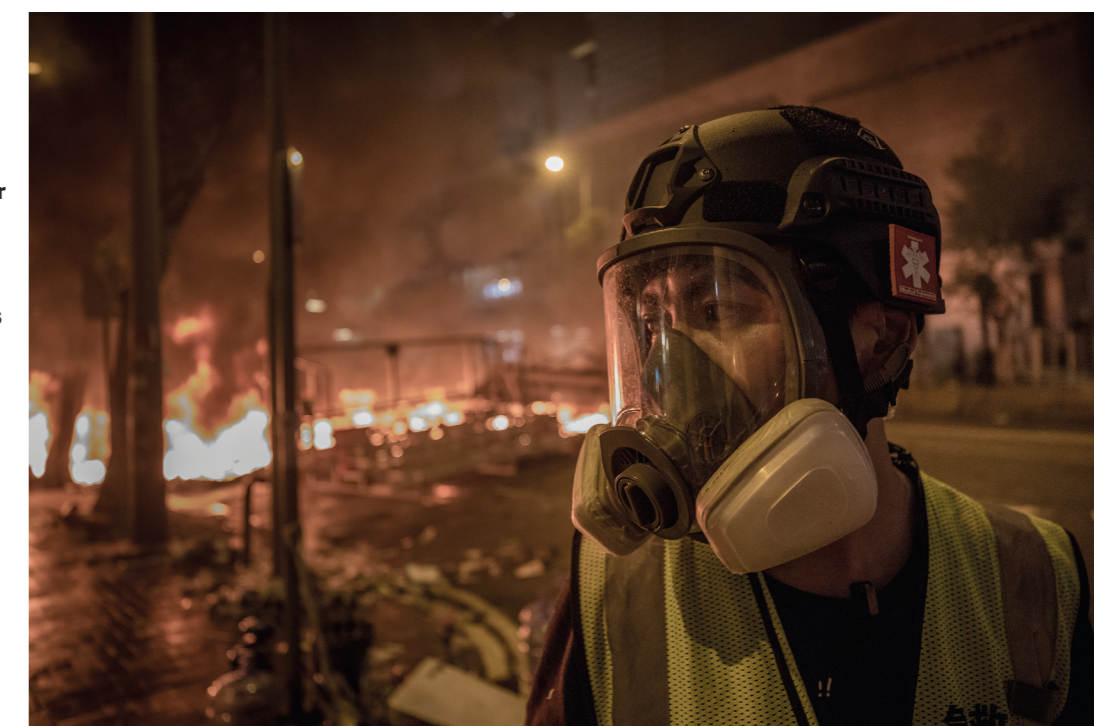
En barrikad brinner i centrala Hongkong.