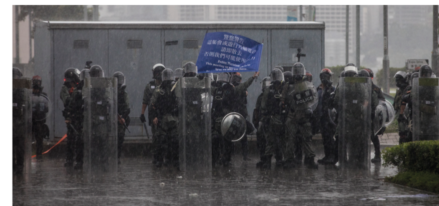
Polis spärrar av vägen.