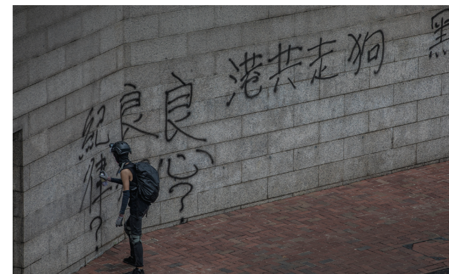
En demonstrant sprejar graffiti på en myndighetsbyggnad