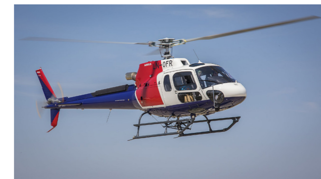
Olycksmodellen. En Airbus AS350.