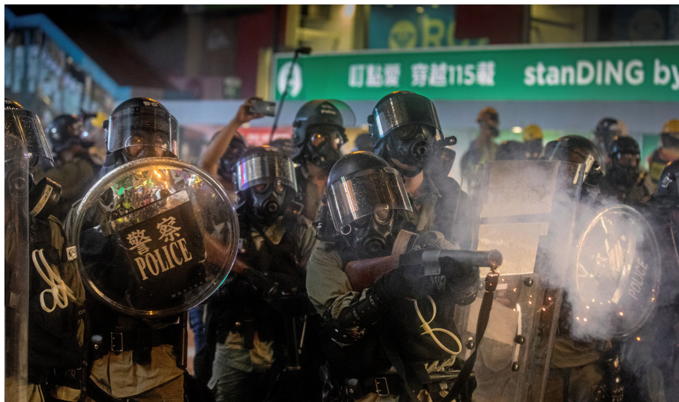
Protesterna i Hongkong fortsatte trots demonstrationsförbud. Det blev hårda sammandrabbningar för trettonde helgen i rad.