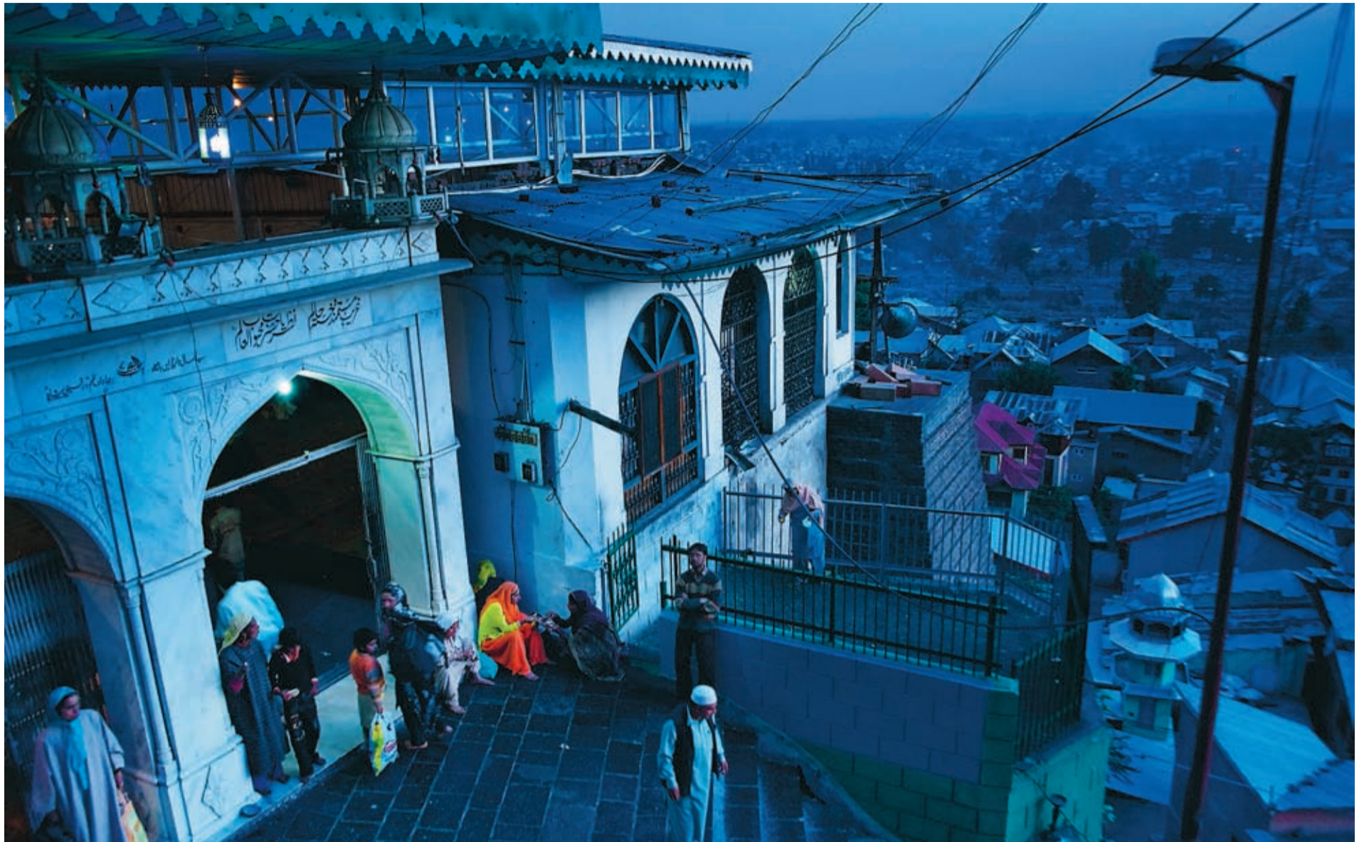
Utsikt över Srinagar, på väg ner från en högt belägen moské. Ljuset i skymningen och gryningen är magiskt, inte minst över den centralt belägna sjön Dal Lake.