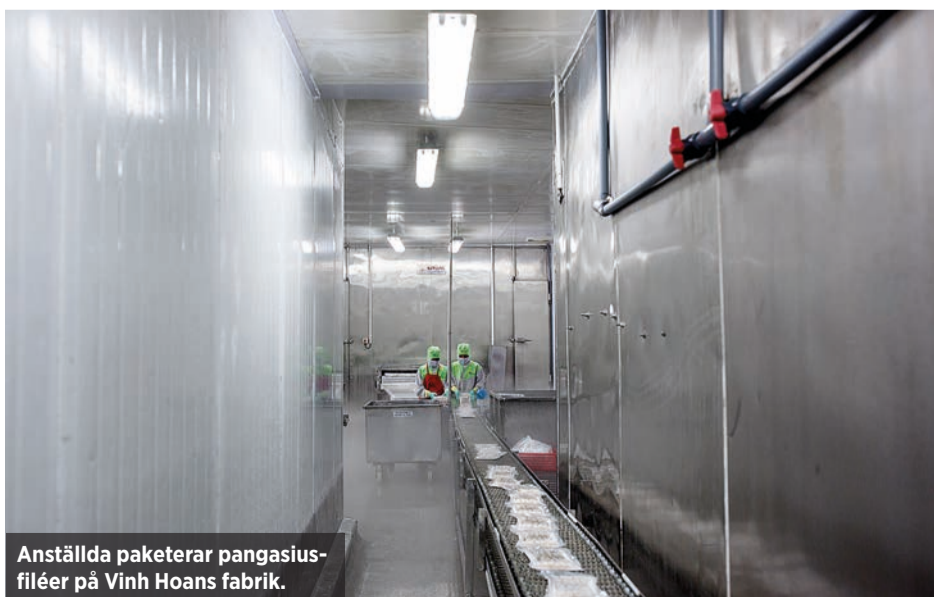
Anställda paketerar pangasius-filéer på Vinh Hoans fabrik.