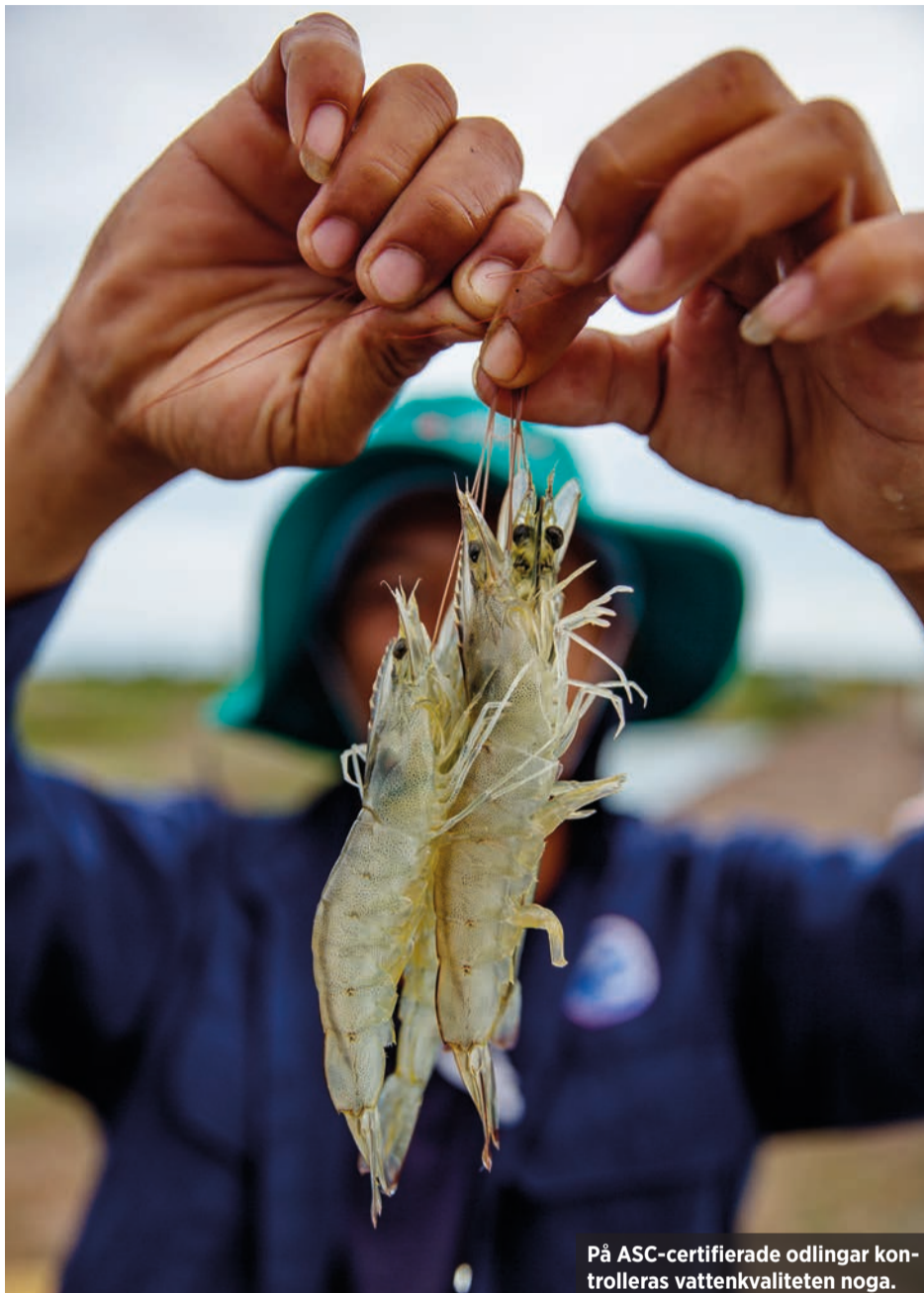
På ASC-certifierade odlingar kontrolleras vattenkvaliteten noga.