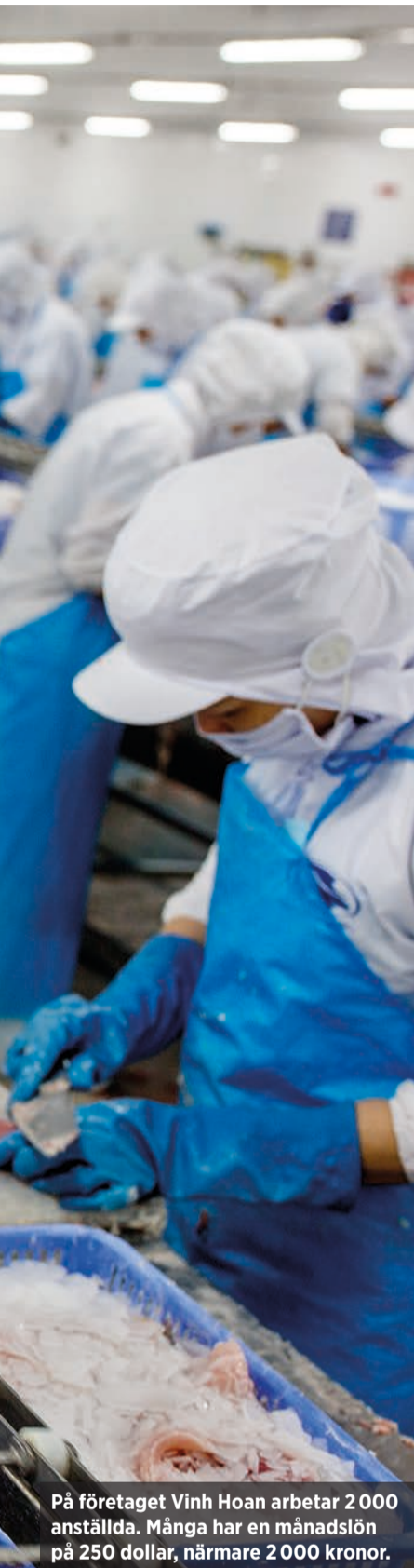
På företaget Vinh Hoan arbetar 2 000 anställda. Många har en månadslön på 250 dollar, närmare 2 000 kronor.

amerikanska och fem kubanska diplomater i Havanna har fått hörselskador efter ljudattacker mot USA:s ambassad i Kuba.