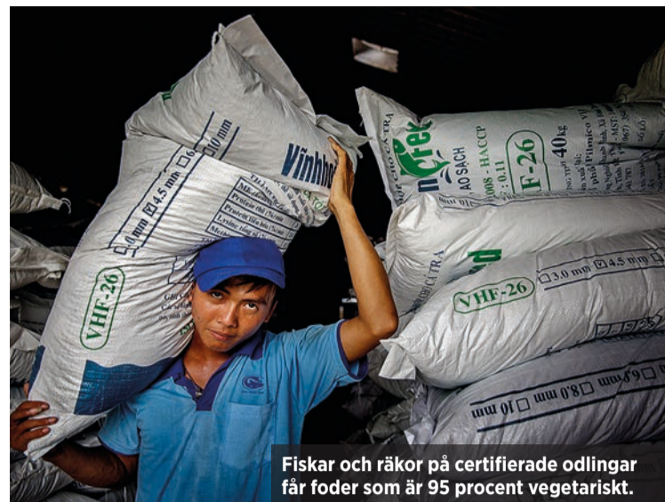
Fiskar och räkor på certifierade odlingar får foder som är 95 procent vegetariskt.