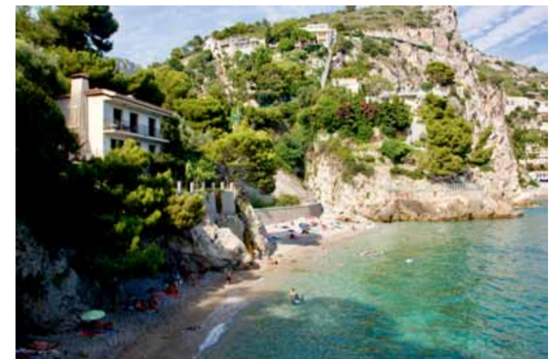
■ Stigen ner till Eze Beach liknar ett tropiskt badparadis, och nere vid havet rullar små vågor in över de småstenar som bildar stranden.