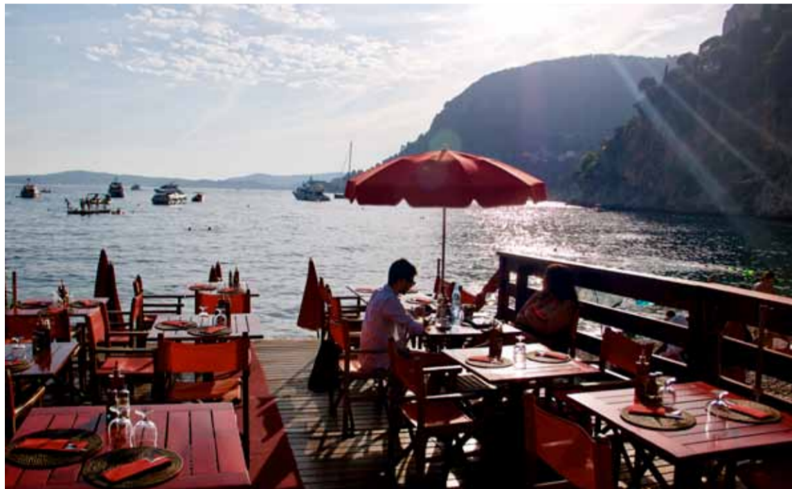
■ Mala Beach har någonting för alla, inklusive restauranger och barer precis vid vattnet.