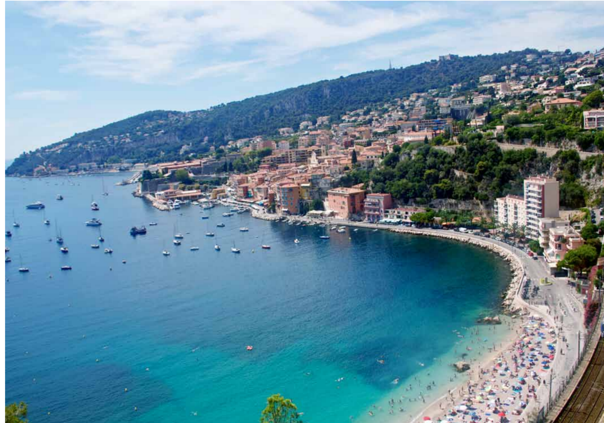
■ Från Nice kan man cykla både åt öst och väst, men den som inte tycker om höjdskillnader bör sikta västerut.

co. Den första sträckan genom hamnen i Nice är platt och imponerar med färgsprakande arkitektur. Snart börjar kullarna och uppförbackarna, och fokus flyttas från omgivningarna till asfalten under cykeldäcken. Det är ungefär lunchtid, solen står i zenit med en värme som ligger en bra bit över 30-strecket, och svetten rinner över min bara överkropp.