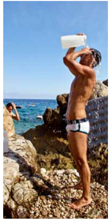
■ Eze Beach är huvudsakligen en gaystrand för män.

● Buss 100 går regelbundet mot Monaco från hamnen i Nice och stannar vid Eze Beach och Mala Beach.