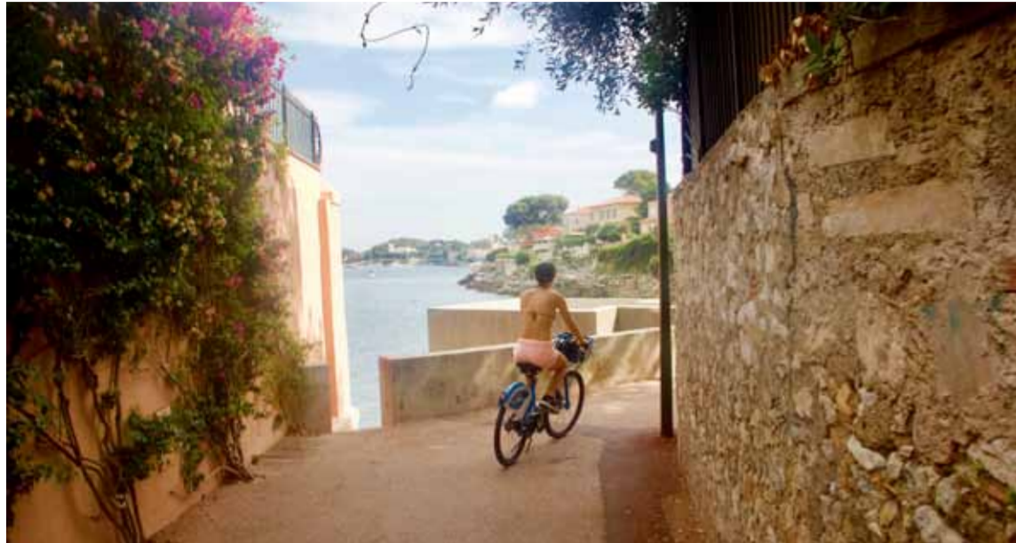
■ På halvön Saint-Jean-Cap-Ferrat följer vi smala passager längs avskilda gator tills cykelleden slingrar sig längs kusten och Promenade Maurice Rouvier.