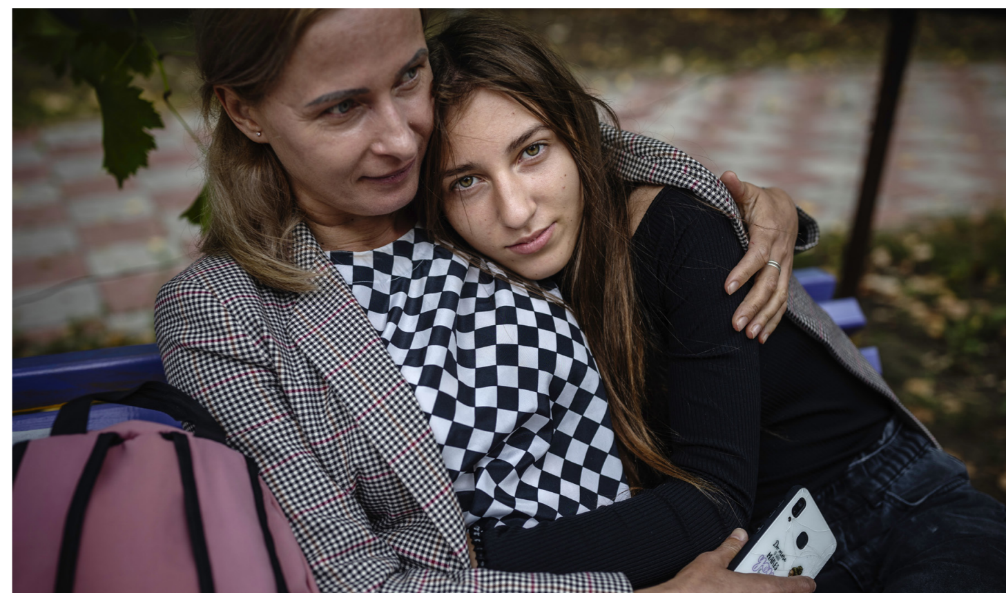
En ukrainsk mor och en dotter har precis anlänt till Moldavien från Ukraina och söker hjälp av organisationen Moldova for Peace.

– Vi hade ett bra liv i Ukraina innan kriget, och nu måste vi se till att göra det bästa av situationen här också.