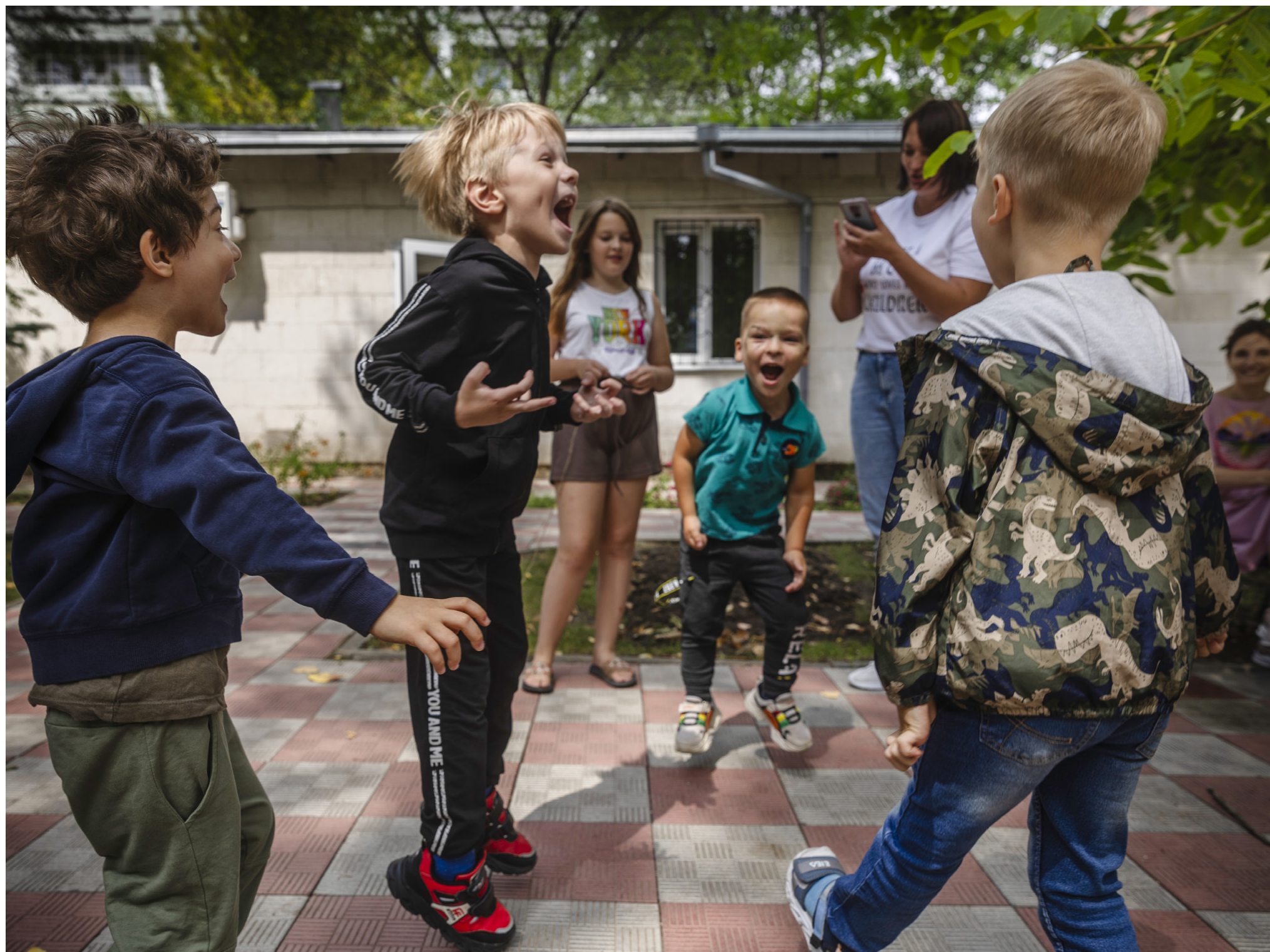
På innergården där organisationen Moldova for Peace ligger anordnas lekar för ukrainska flyktingbarn.