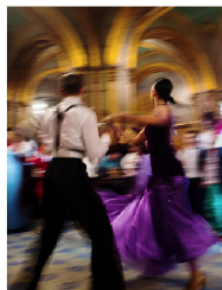
Rumänska folkdanser är en vanlig syn på restauranger och baren, som här i Bukarests gamla stad.

Det är en smått komisk syn, där kreaturen verkar veta sin egen plats i kön, och där var och en viker av vid