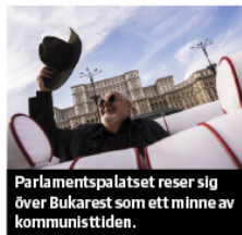
Parlamentspalatsets reser sig över Bukarest som ett minne av kommunisttiden.