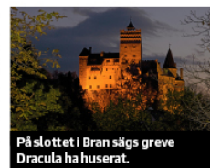
På slottet i Bran sägs greve Dracula ha huserat.