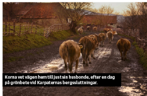
Korna vet vägen hem till just sin husbonde, efter en dag på grönbete vid Karpaternas bergssluttningar.

Den lilla byn har utvecklats från att ha haft några hus nedanför borgen i början på 70-talet – då björnar och vargar vandrade omkring fritt bland husen – till att i dag ha 4 000 sängar på vandrarhem som kan husera busslasterna med turister från hela världen varje år.