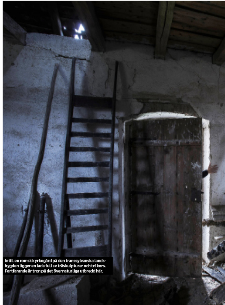
Intill en romsk kyrkogård på den transsylvanska landsbygden ligger en lada full av träskulpturer och träkors. Fortfarande är tron på det övernaturliga utbredd här.

jul, så då måste den vara välgödd, säger Kovács med ett skrat.