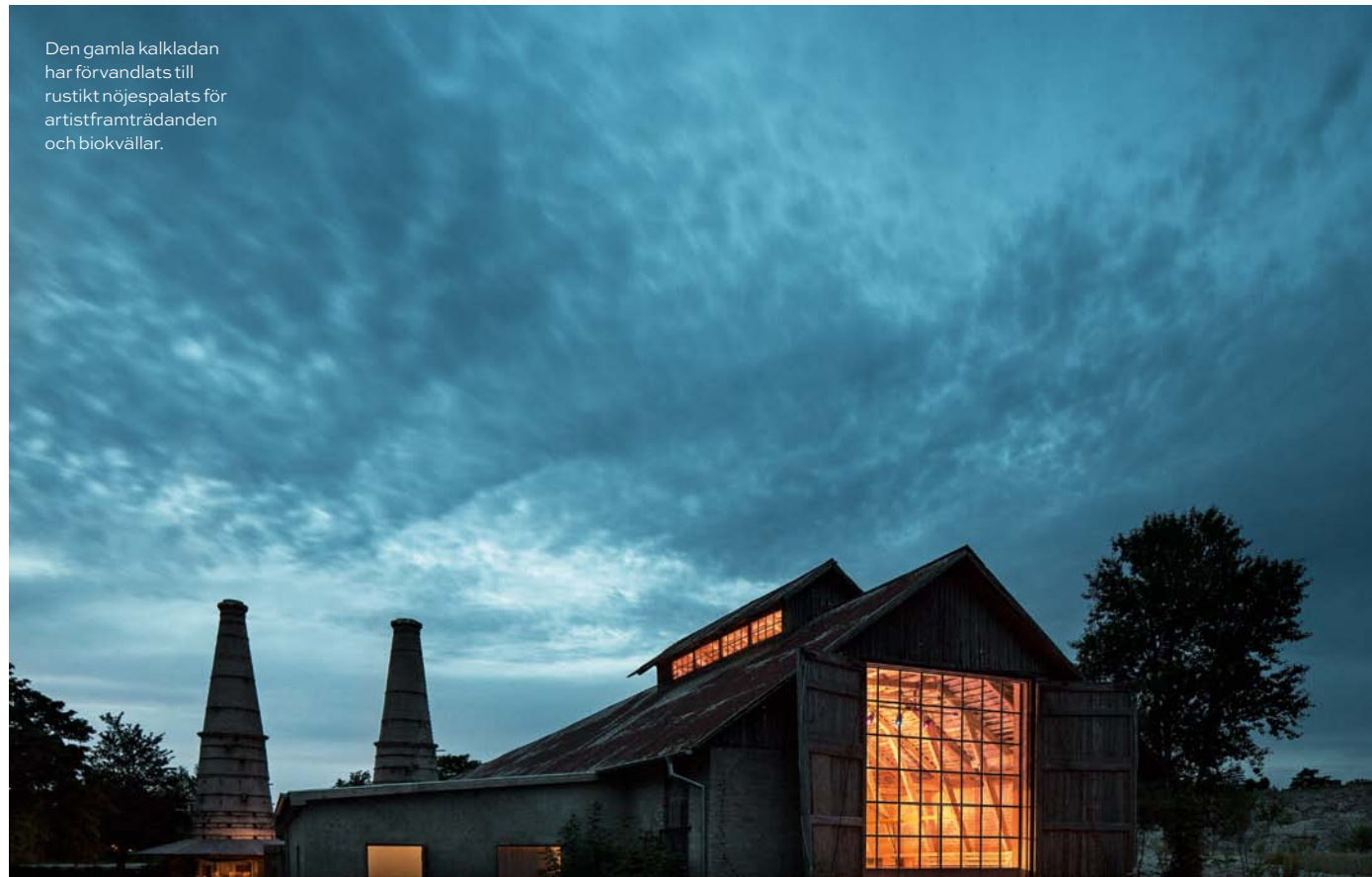
Den gamla kalkkladan har förvandlats till rustikt nöjespalats för artistframträdanden och biokvällar.