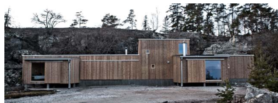
Österklint 20 är anpassat till naturens strandskydd och brottkant.