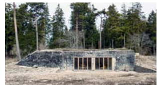
Byggnad 8 i en framgrävd bunker som var mekanisk verkstad.

Bungenäsprojektet upptar en stor del av Skälsö Arkitekters tid, där kontoret har gjort detaljplanen för hela området, renoverat befintliga byggnader, ritat flera nybyggda hus och omvandlat befintliga bunkrar till fritidshus.