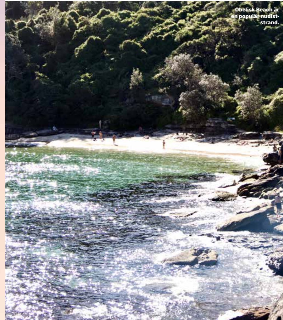
Obelisk Beach är en populär nudiststrand.