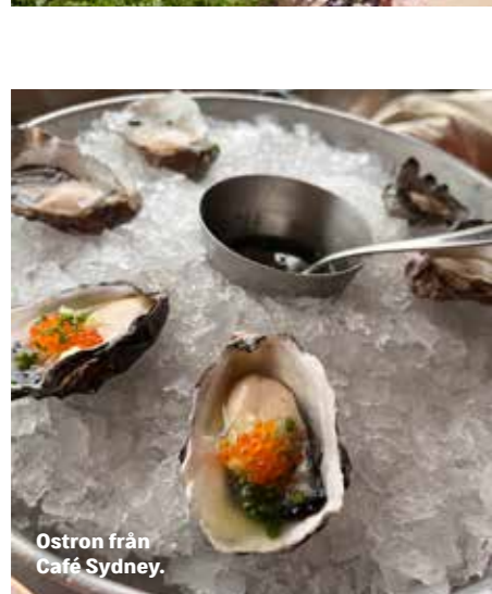
Ostron från Café Sydney.