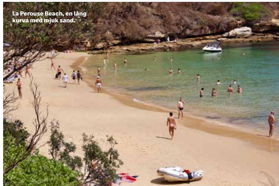
La Perouse Beach, en lång kurva med mjuk sand.