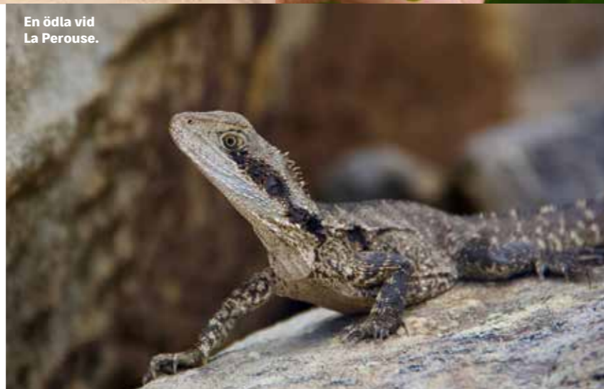
En ödla vid La Perouse.