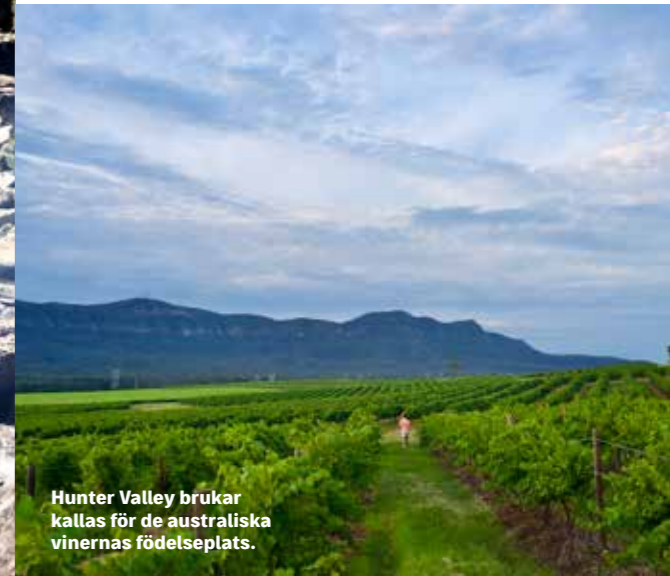
Hunter Valley brukar kallas för de australiska vinernas födelseplats.

”Havet glittrar i solen och på ytan ligger yachter i olika storlekar, där besättningarna dricker cocktails och dyker i det turkosa vattnet”