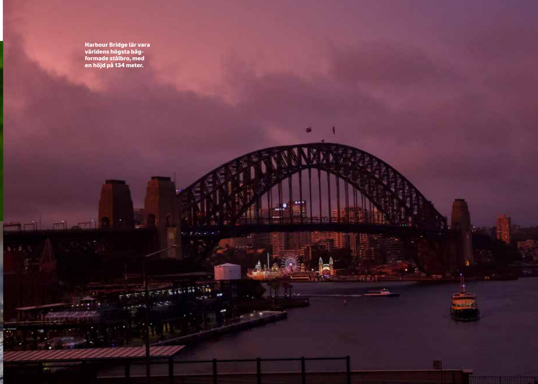
Harbour Bridge lär vara världens högsta bågformade stålbro, med en höjd på 134 meter.

”Det rosa kvällsljuset sveper in Harbour Bridge i ett skimmer, och middagen som redan har pågått i tre timmar känns långt ifrån utdragen”