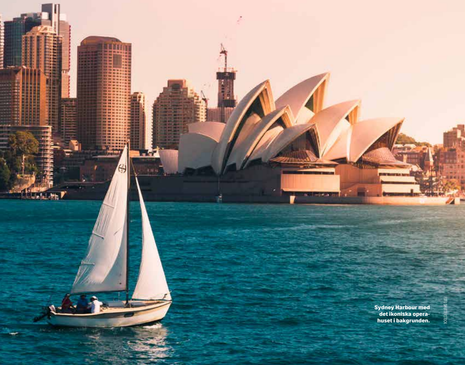
Sydney Harbour med det ikoniska operahuset i bakgrunden.