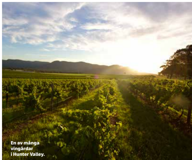
En av många vingårdar i Hunter Valley.

Några män sitter på de runda småstenarna, formade av havet, och blickar ut till havs. Strömmarna är kraftiga, så ingen vågar sig långt från stranden, för det finns inga livräddare som kan rycka ut. Strandens kan inte bli mer avslappnad, trekken hit går även under benämningen "nude walk", och även om äventyrarna på stigen behåller kläderna på ser de snabbt till att slänga av sig dem och sola nakna när de kommer till de stora gräsplättarna som breder ut sig ovanför stenstranden. Stenarna, i varierande färger och material, är en attraktion i sig, och vi går på stensafari i vattenbrynet. Trekken tillbaka upp är tuffare och kanske inget för den mest otränade, den är ett hårt gympass i 70 procents luftfuktighet, med blodiglar som väntar på att kasta sig över blottade ben. Tillbaka vid bilen är det kanske den genomgripande svetten som har avskräckt blodsugarna. Oavsett vilket bär det tillbaka till Sydney igen, där nya upplevelser väntar. ♦