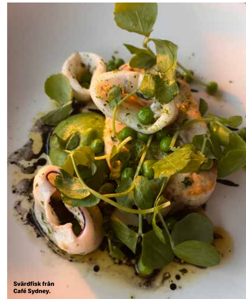
Svärdfisk från Café Sydney.