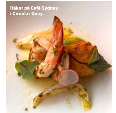
Räkor på Café Sydney i Circular Quay.